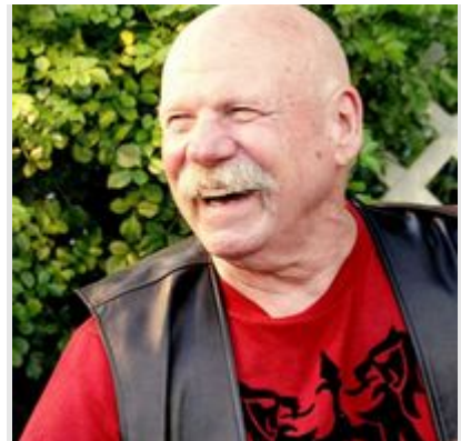
Sein Song «Eve of Destruction» ist 43 Jahre nach seinem Erscheinen aktueller denn je.

Ich verstehe nur sehr, sehr wenig von Gott. Nur schon der Blick ins Universum zeigt Gottes Mysterium - die gewaltige Ausdehnung, die unfassbaren Distanzen, Galaxien, die sich mit Lichtgeschwindigkeit voneinander entfernen. Es dehnt sich aus in ein Etwas, das wir nicht einmal erahnen können. Wir bezeichnen das All als einen leeren Ort und denken, es wäre ein Nichts. Aber alles, was ist, entstand daraus. Das Nichts muss also etwas sein. Ich stelle mir vor, dass das Universum nichts ist als ein kleiner Fleck, der praktisch inexistent ist, nur gehalten vom ewigen Ozean des göttlichen Seins. Mit unseren erbsengrossen Hirnen können wir uns nicht einmal ansatzweise ausmalen, wie gross Gottes Mysterium ist.